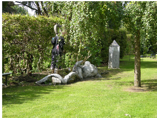
Billedkunsthaven med tidligere elevers eksperimenter

Du går i gang med det du gerne vil realisere. evt. med hjælp af en billedkunstlærer. Materialer betales delvist af skolen.